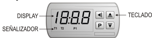
Figura 2 – Panel frontal del controlador

En el panel frontal del controlador el señalizador P1 enciende cuando la salida de control es ligada.